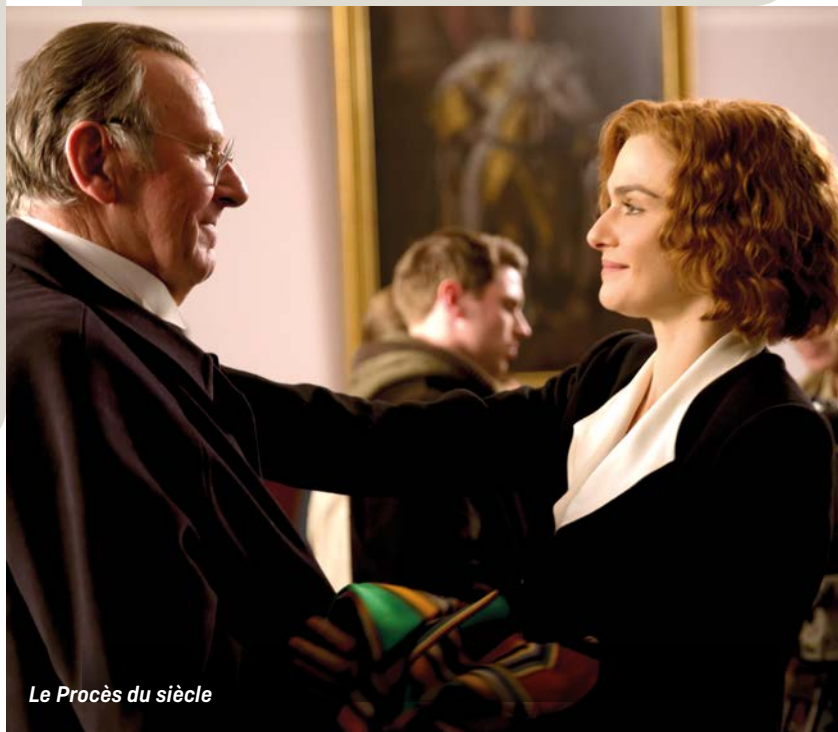
Le Procès du siècle

Dans tous ces cas, nous pouvons vous conseiller pour organiser avec vous à Liège au Parc ou au Sauvenière (ou dans certains cas plus rares au Churchill) ou à Namur au Caméo une séance scolaire « à la carte » pour autant qu'un minimum d'élèves puisse être réuni : dans ce cas, le prix sera de 4,60 € par élève.