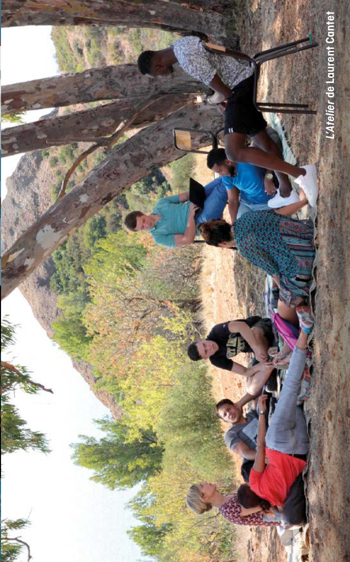
L'Atelier de Laurent Cantet