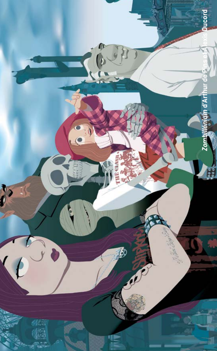
Zombihilénium d'Arthur de Pins et Alexis Ducord