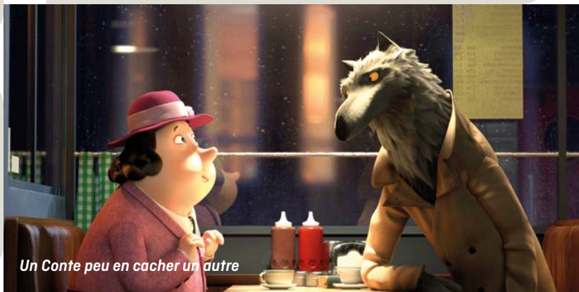
Un Conte peu en caché un autre

GRIGNOUX, 9 rue Sœurs de Hasque 4000 LIÈGE